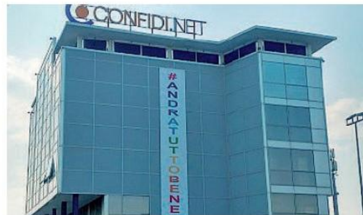
La sede di Confidi.Net