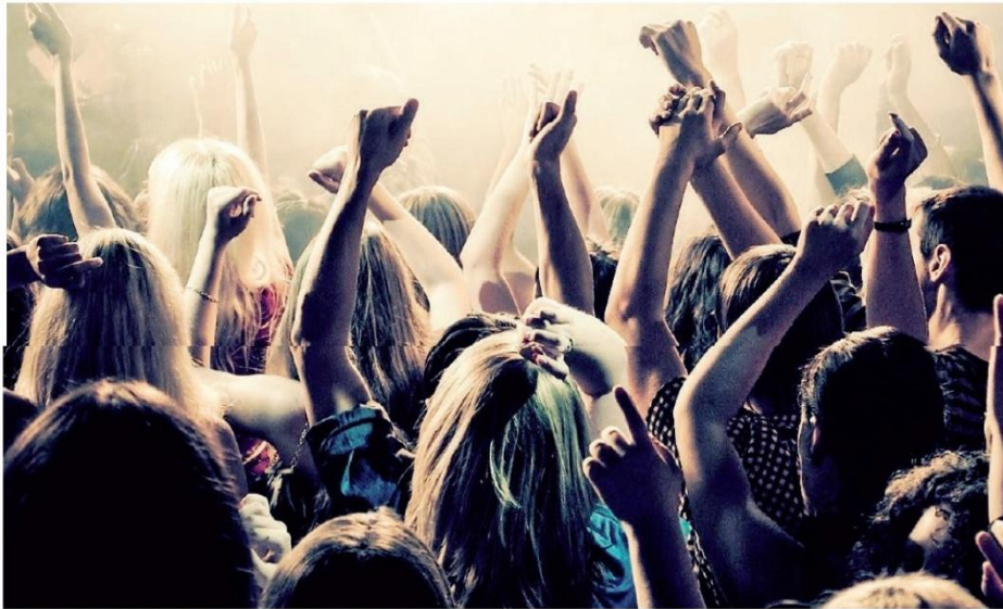
I ragazzi mentre ballano in discoteca: chi donerà alla riapertura potrà farlo gratis

CORONAVIRUS LA SOLIDARIETÀ AL TEMPO DELLA PANDEMIA