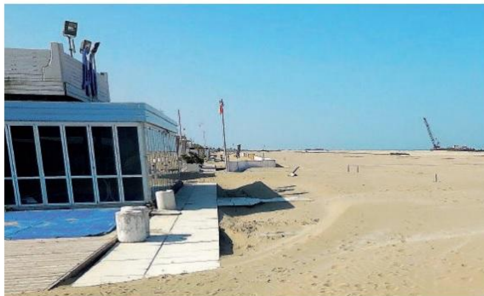
Bar di spiaggia chiusi e arenile deserto

rato Indino - si farà portavoce presso il governo di queste istanze. «Siamo fiduciosi che si possa avere un parere favorevole per iniziare con i lavori ai primi di maggio».