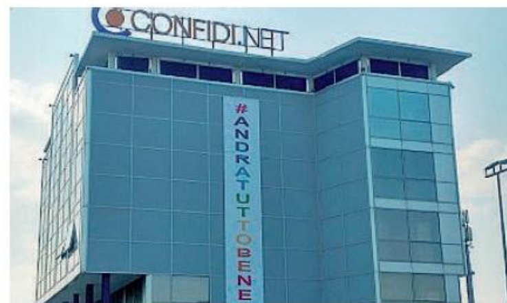
La sede di Confidi.Net