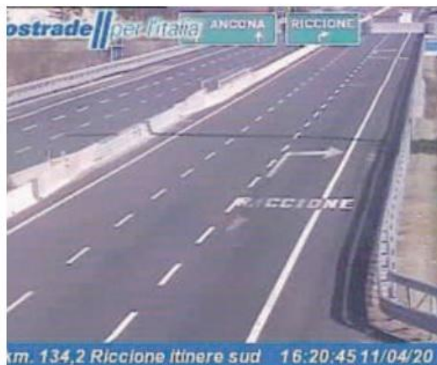
Autostrada deserta ieri pomeriggio: l'uscita di Riccione

Invece? «Dai primi di marzo i grandi centri commerciali stanno vivendo ogni giorno un Natale e con loro le multinazionali dell'on-line, mentre i piccoli commercianti stanno soffrendo e dovranno aspettare ancora per poter tirare su le serrande. Sem-