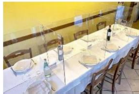
Immagine degli 'stabilimenti Covid' che circolano in Rete: per gli operatori è «pura fantasia». Sotto