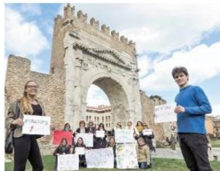
Le guide turistiche manifestano sotto l'Arco d'Augusto

«Oltre 300mila euro di mancati incassi soltanto nel mese di marzo»