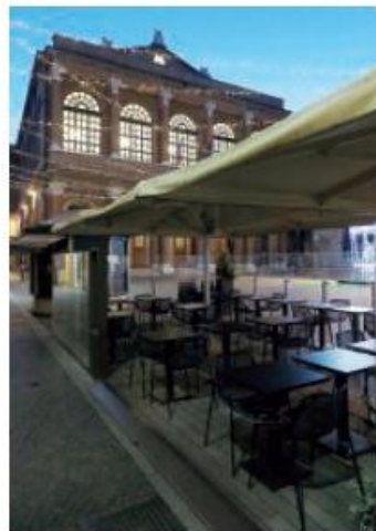
I locali del centro hanno rispettato il decreto: chiusi alle 18

Il termometro del numero uno della Fipe volge al peggio, la sua non sarà l'unica chiusura in attesa di tempi migliori. «Rimarrà aperto qualcosa nel centro storico, locali che lavorano con i buoni pasto a pranzo, ma ho avuto contatti con colleghi disperati, il no-