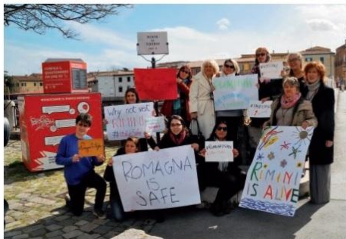
Il flash mob delle guide

Torri comunica che oggi è a Roma come Confguide nazionale (di cui è vice presidente) per partecipare a un tavolo parlamentare con la commissione turismo. In tutta Italia Confguide rappresenta 1.200 professionisti.