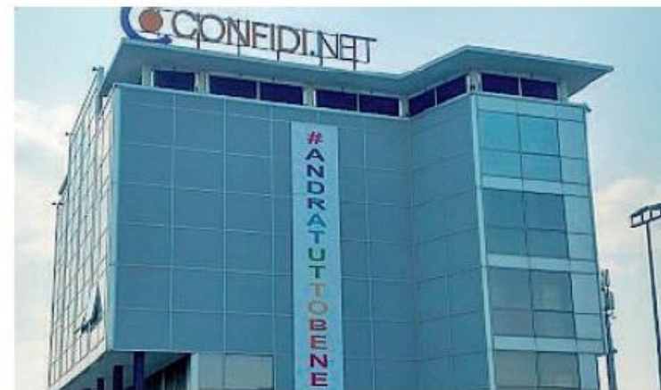
La sede di Confidi.Net

«Forse siamo in ginocchio di fronte a questo maledetto virus, ma non possiamo arrenderci come non si arrende il personale sanitario che combatte una guerra strenuamente. Ci rialzeremo e, dopo una battaglia da combattere insieme, andrà tutto bene», è il messaggio positivo del presidente di Confidi.Net, Alduino di Angelo. «In questo momento di dif-