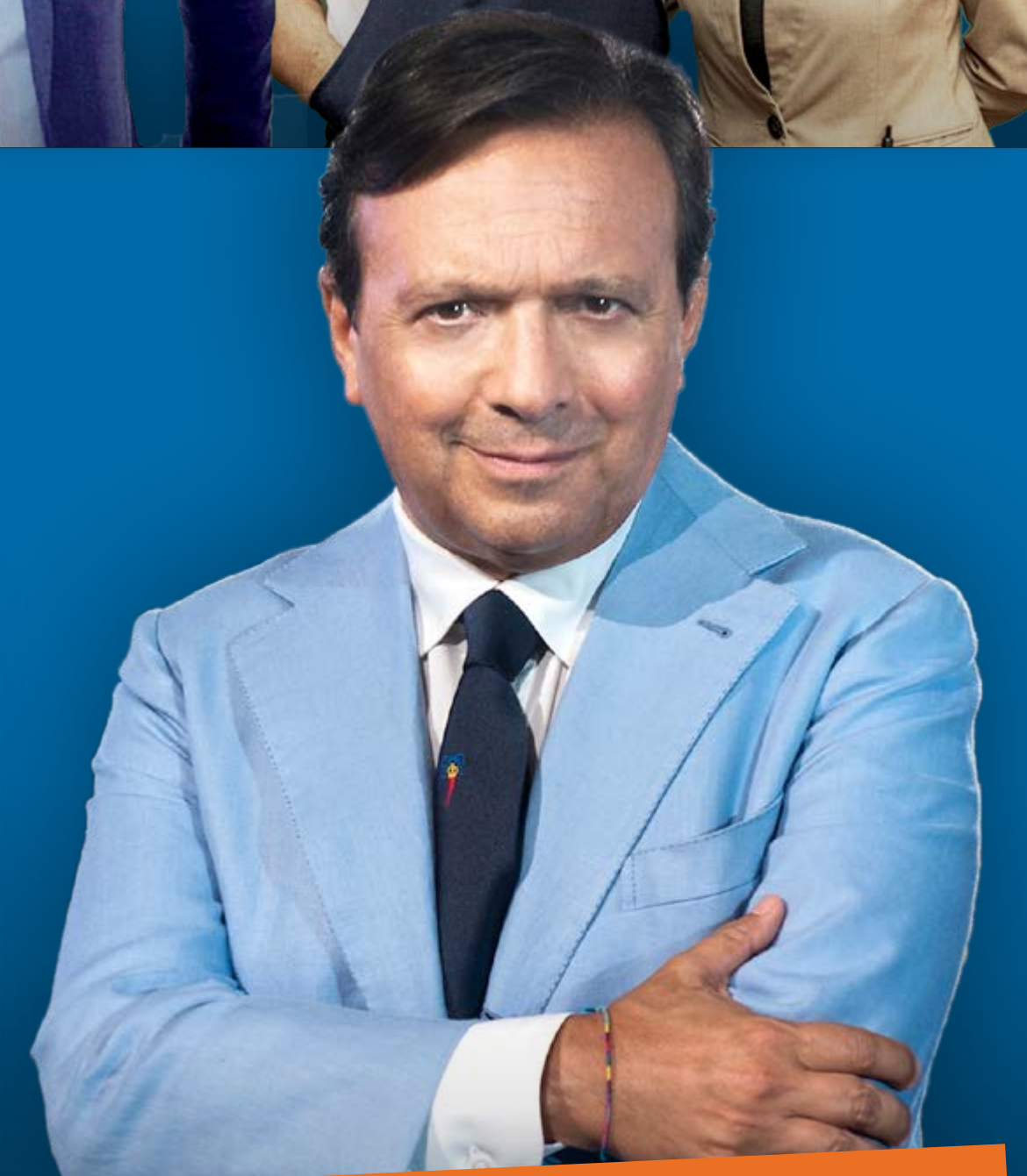
Piero Chiambretti Conduttore tv e imprenditore della ristorazione

Lunedì 25 febbraio ore 14:30 Palacongressi di Rimini - Sala dell'Arengo