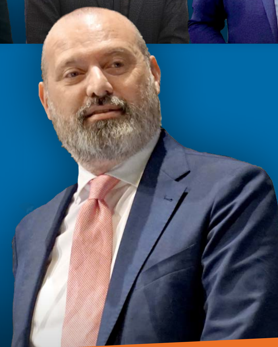
Stefano Bonaccini Presidente Regione Emilia Romagna